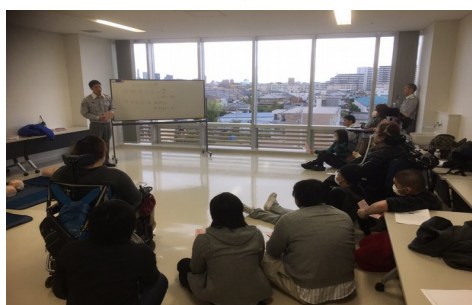
11月は救命救急研修と題して桜区の消防隊員さんをお呼びさせていただきました。 場所は事務所ではなく桜区役所で行いました。