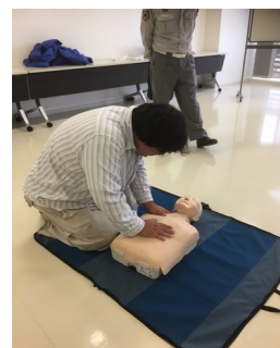
心肺蘇生を行っています。介助者によっては力強すぎていましたが短時間にしては基本を抑えられていたのではないのでしょうか。

介助中は利用者と介助者が一対一になる場合がほとんどです。そういった状況で、もし利用者の意識が無くなってしまったら？という場面をみんなに想定してもらい、救急隊員が駆けつけてくれるまでの応急手当などを勉強しました。AEDなど普段見ることはあっても使用した事のない物も使用し、介助者一人ひとり貴重な経験が出来たと思います。しかし、利用者も人それぞれ。いつどこでどんな状況で緊急性を問われるかわかりません。介助者の皆さんには引き続き意識を強くもってもらい介助に臨んでいただきたいです。